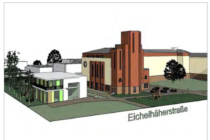
Planung Nachbarschaftstreff und Kita