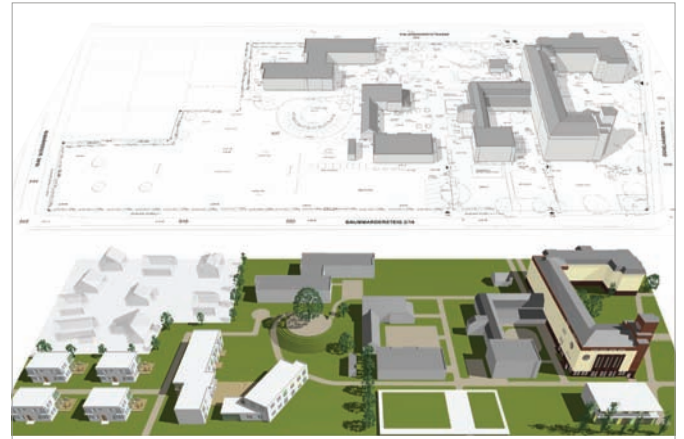
Gesamtgelände - Bestand und Planung