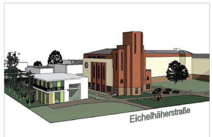
Planung Nachbarschaftstreff und Kita