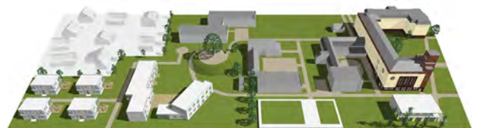
Gesamtgelände - Bestand und Planung